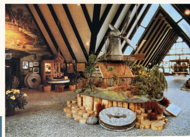
Blick in das Ausstellungsgebäude

In unserer Gastronomie wie dem „Trachtenhaus“ oder dem „Backhaus“, dem idyllischen Biergarten an der Ise mit eigenem Bootsanleger und Blick auf den Schlosspark, dem Lindenplatz, der griechischen Mühle am Mühlensee oder auch bei unseren verschiedenen Veranstaltungen legen wir ganz besonderen Wert auf hochwertige Produkte direkt von Erzeugern aus der Region.