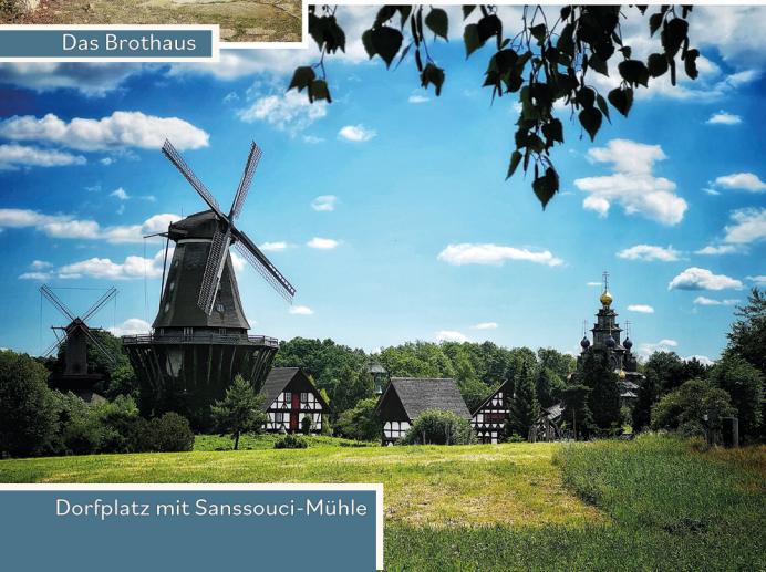
Dorfplatz mit Sanssouci-Mühle