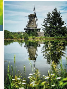
Mühle von Sanssouci