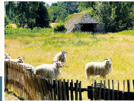
Heidschnucken mit Außen- schafstall