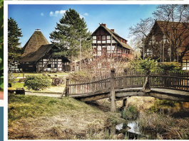
Dorfplatz mit Rossmühle