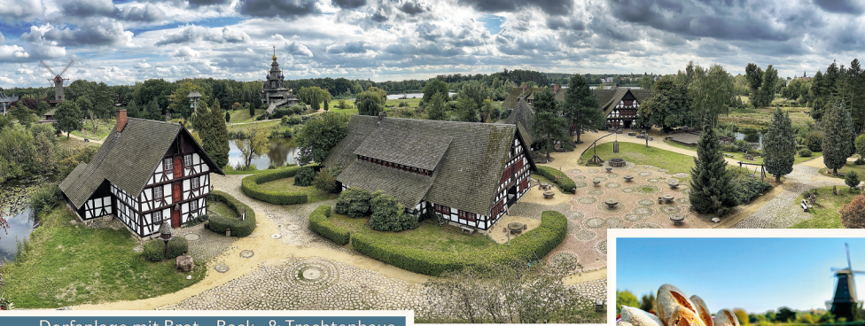
Dorfanlage mit Brot-, Back- & Trachtenhaus

Es erwarten Sie Windmühlen aus Deutschland, Griechenland, Portugal, Spanien, Frankreich und der Ukraine sowie Wassermühlen aus Österreich, Serbien und Korea. Eine Besonderheit bildet die ungarische Schiffmühle als „schwimmende Wassermühle“.