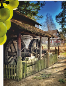
Tiroler Wassermühle & Trachtenhaus